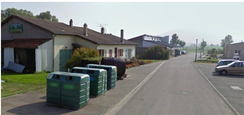
Rue des Triboulottes