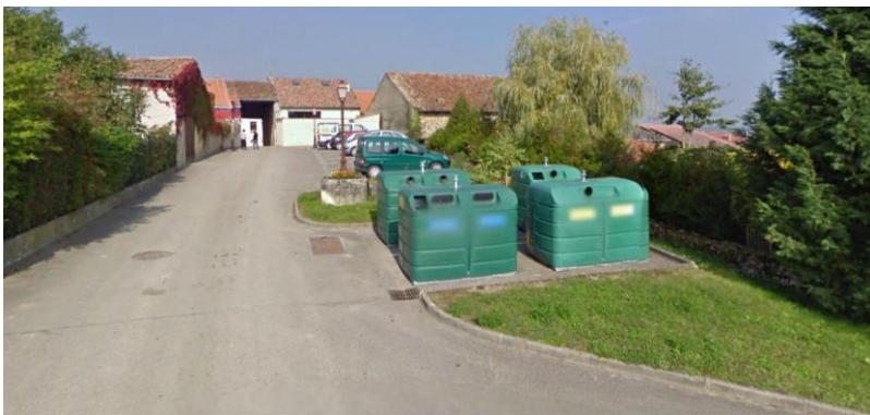
Rue Saint Vincent